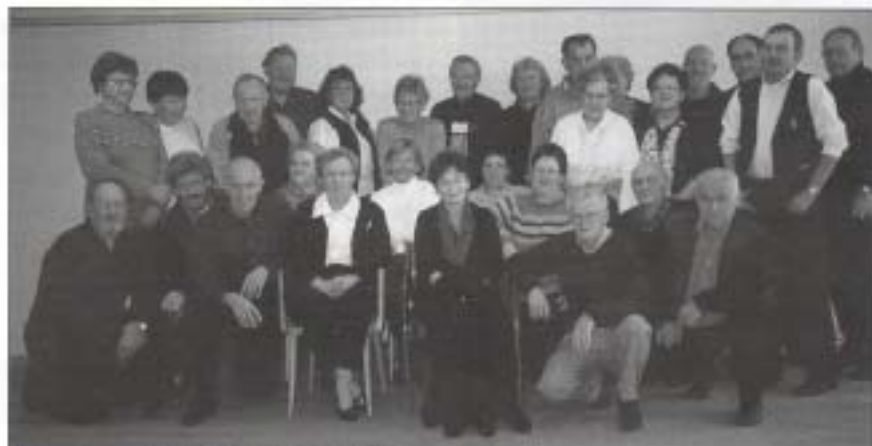
Ikke alle var til stede da bildet ble tatt.

Buskerud Lag av landsforeningen for Løsemiddelskadde - LFFL hadde i tiden 22. – 24. oktober familieseminar på Oset Høyfjellshotell.